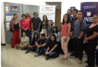
Estudiantes de primer ingreso aprovecharon las vacaciones de verano para participar en el curso APREVAL.

Los cursos EDECOM y EVAPES se ofrecerán nuevamente a finales de marzo. Este proyecto es auspiciado por la Comisión Europea en la convocatoria Alfa III.