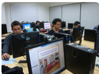
Al curso EDECOM asistieron estudiantes de música, orientación, zootecnia, aduanas y comercio exterior, entre otras carreras.

Parte de los objetivos del proyecto son reducir la deserción de los estudiantes universitarios en los dos primeros años y facilitar la inserción de los egresados al mercado laboral .